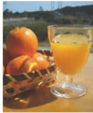
生搾りみかんだームジュース (期間限定10月~4月)