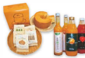
西海市産土産菓子・ジュース