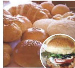
パン&ハンバーガー