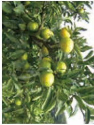
■岩崎みかん 9月中旬~10月