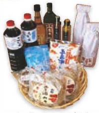
西海市産調味料 塩・味噌・酢・醤油